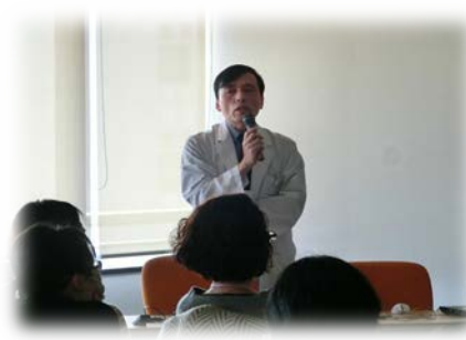
ミニレクチャー「ライフステージに応じた緩和ケア」 医学研究科 恒藤 暁 教授