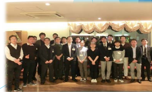
2月5日 情報交換・懇話会